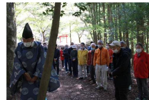
昨年の山開きの様子

神ノ川折花神社に於て、恒例の山開き神事を4月10日(日)午前10時より行い、今年も山での無事を祈願します。各自コロナ対策の上ご出席よろしくお祈りします。(参加者50名予定)